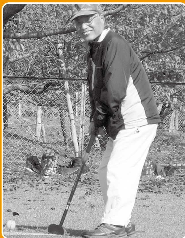
赤い羽根チャリティグラウンドゴルフ大会の様子

共同募金は、地域ごとの使い道や集める額を事前に定めて、募金を募る仕組みです。集まった募金の約7割は、募金をいただいた庄原市内で使われています。