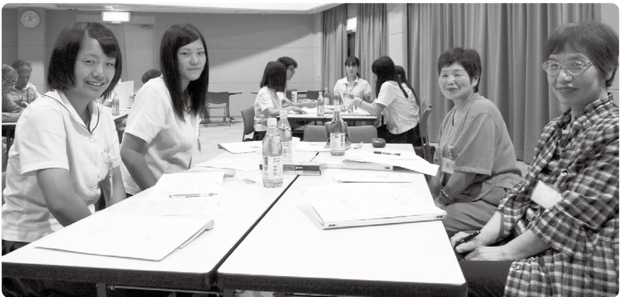
参加者は、各テーブルに分かれ、説明や話を聞きました

このボランティア講座は、若者世代やシニア世代、ボランティア活動に関心のある方などが、よりボランティア活動への関心と理解を深め、ボランティア活動をはじめめるきっかけづくりと、地域福祉推進の担い手となるボランティアの養成を目的としています。