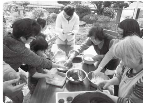
みんなでおはぎづくり(つくしんぼうの会)