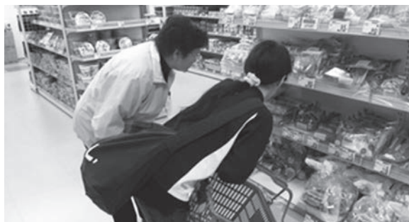
やまびこネット 365 事業の活動 — 買い物をお手伝い —

誰でも、一方的に支援を受けているばかりでは心苦しさを感ずります。また、支援する側も誰かのためだけではなく、「自分のためでもある」「私たちの問題(地域課題)でもある」という気持ちで活動が広がっていく事が、ねらいの1つでもあります。助けあい活動は、自分のできる事を活かしたい人、暮らしの困りごとを手伝ってほしい人、そういった人の思いがつながり合って活動が始まります。この活動は、双方の思いを汲んで調整していく事で、大きな喜びが生まれていきます。