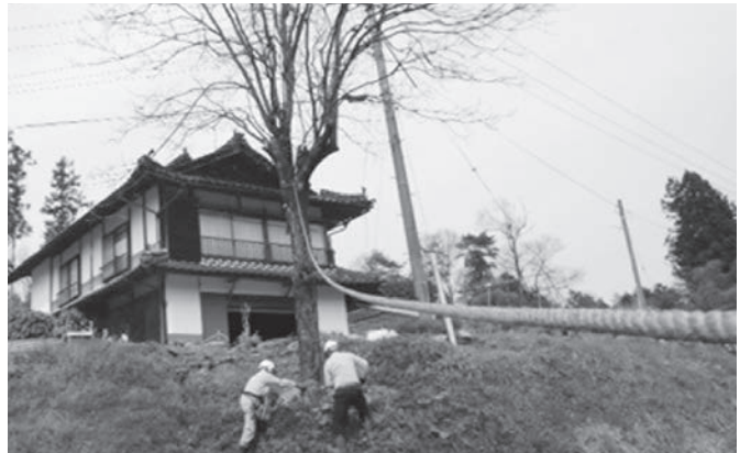
峰田自治振興区「お助けネット峰田」の活動 一柿の木の伐採—

『助けあいによる生活支援を広げるために ～住民主体の地域づくり～』参照(全国社会福祉協議会発行)