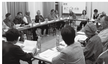
新坂まごころの会(会議の様子)

“新坂で安心して暮らしたい”という思いを実現するために、みんなが協力して地域づくりを焦らず確実に進めていきたいとがんばっています。