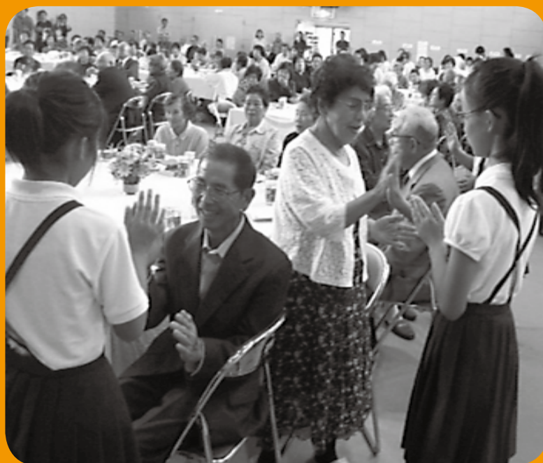
敬老会にて交流（山内小学校）

社会福祉協議会では、心の通う福祉の地域づくりの推進を目的に“福祉教育指定協力校事業”を実施しています。