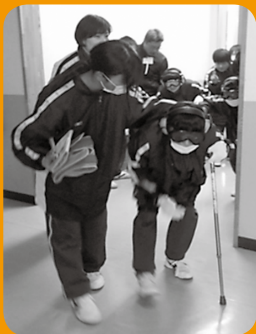
高齢者疑似体験（総領中学校）