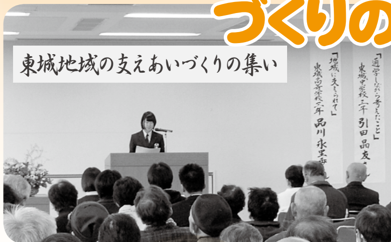
昨年度の様子 (写真)

社会福祉協議会は、誰もが安心して暮らし続けられる地域をめざして、一人ひとりにできること、また地域に必要な支えあい活動の仕組みづくりを関係団体と連携して進めています。