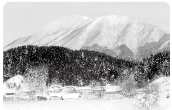
雪景色の毛無山

遠くの名山への想いはあるものの、春の雪解けを待ち、まずは郷里の山に出かけ、いつか悔しさの解消を！と、思っています。