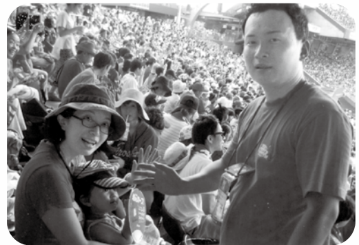
マツダスタジアムで庄原子どもミュージカルで出演

妻とも話していますが、総領町は地域の皆さんが本当に温かく、子育てしやすい環境だと感じています。この自然豊かな総領町で、地域の皆さんに見守られながら、のびのびと育てて欲しいと願っています。