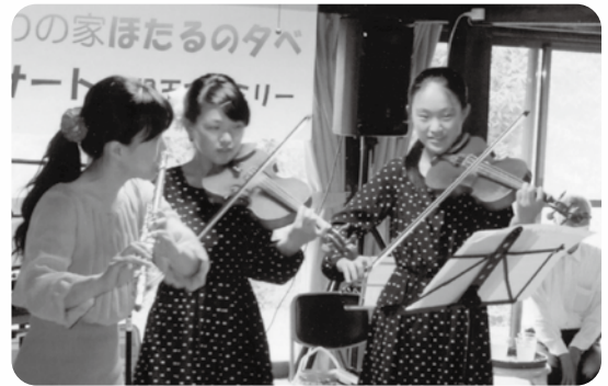
コンサートの様子 (庄原暮らしお試し体験施設くちわの家にて)

これからも、音楽や芸術を通して色々な人たちと“つながり”ながら、口和町の生活を楽しんでいきたいと思っています。