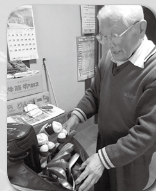
愛用しているゴルフセット

更に、食生活においては、食べる量は少なくなりましたが好き嫌いなく、食べるのが大切だと思います。