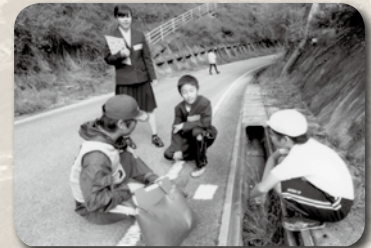
庄原・高町 認知症高齢者への対応 (SOS 模擬訓練)