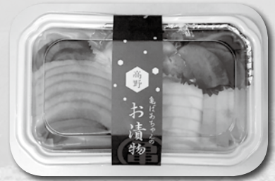
出荷している漬け物

今回、3 名の方々からお話を聴きながら、健康寿命を長くするためには、暮らしの中で多種多様な趣味や生きがいをもつことも必要だと感じました。