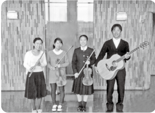
ご家族で音楽に取り組んでいます。※ご本人は左側