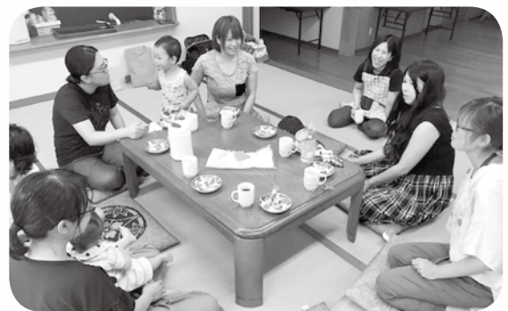
子育てサロンのママさん達

まだまだ、分からないことばかりなので、皆さんから色々なことを教わりながら少しずつ成長していきたいと思っています。よろしくお願いいたします。