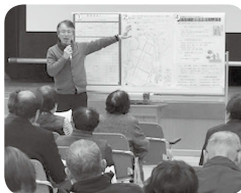
比和きずな会主催講演会

平成 30 年度は、ひきこもりの支援のほか地域の助け合い活動など 6 団体の取り組みへ助成を行いました。