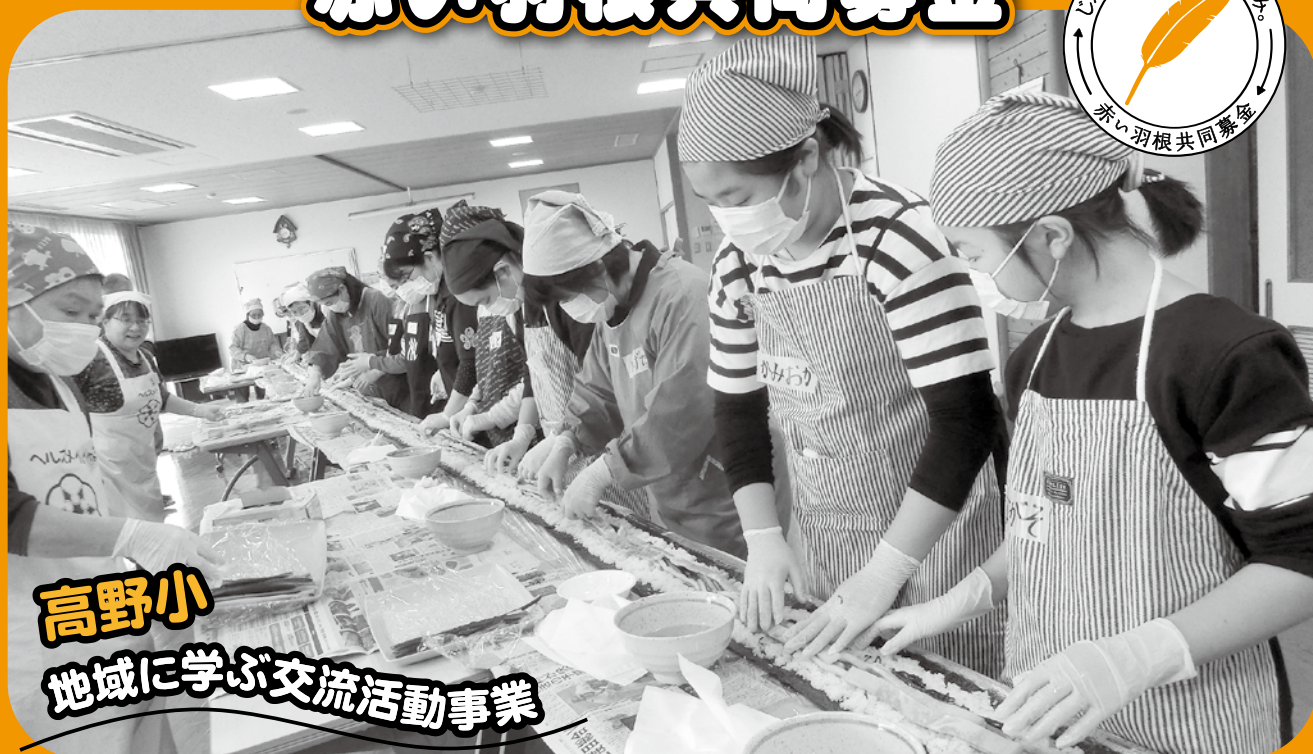
高野小 地域に学ぶ交流活動事業

高野小学校では、地域と連携し、地域の方と児童が交流をしながら昔遊びや伝統行事等を教わることで、高野地域に対する思いやりや感謝の心を育てています。