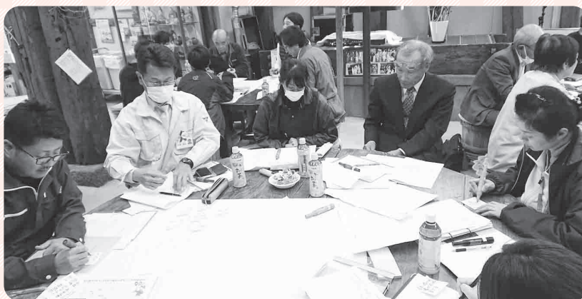
策定委員会の様子