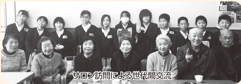
サロン訪問による世代間交流