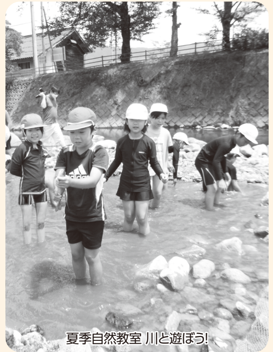
夏季自然教室 川と遊ぼう!