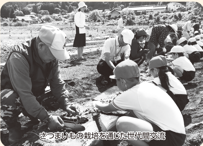
さつまいもの栽培を通じた世代間交流