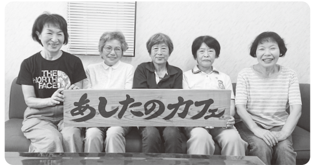
未来の会の皆さん

認知症は種類によって、症状の進行を遅らせることができます。早期発見、早期受診につなげる事が重要です。不安に思ったら、家族はもちろん、地域でもそっと相談できる場所があると嬉しいですね。